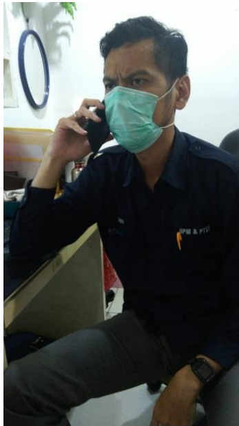
PT Surya Sentral Diorama

Jumlah Perusahaan yang Diberikan Asistensi Online Sebanyak 1 Perusahaan