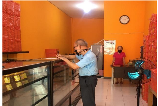
Toko Gwens Bakery Jl. Tambakrejo 84-A