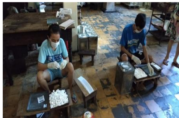
Perusahaan Perorangan MADJOE Jalan Kapas Krampung No.2 Surabaya