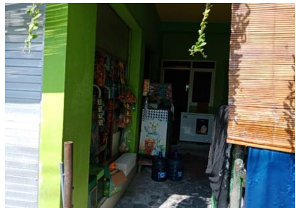
Jl Karanganyar IV no 7