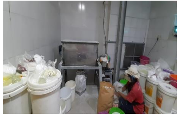
PT Welco Jl. Kromowijoyo 1-3 Surabaya