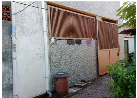
Jl. Karanganyar III No. 26