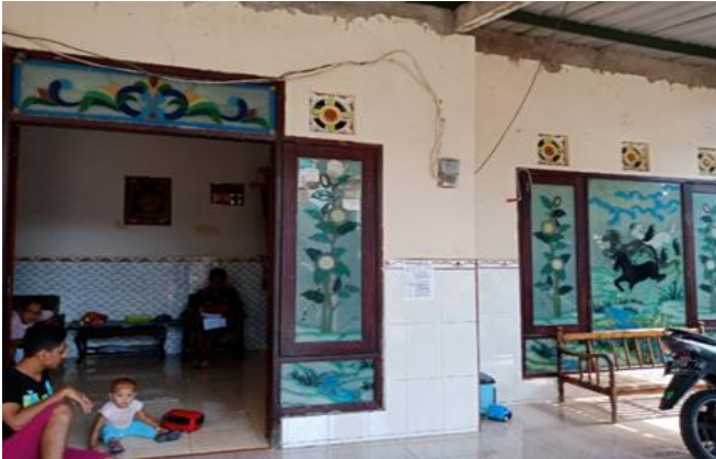
Jl Karanganyar V no 8A