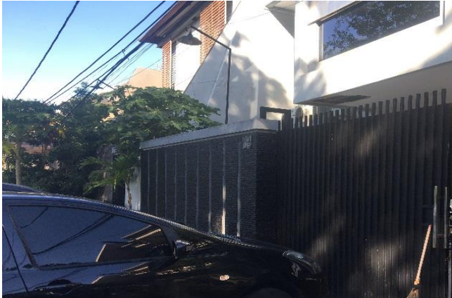
CV. Surya Kartika Chandra Jl. Kertajaya Indah Timur 12 Blok. O - 640