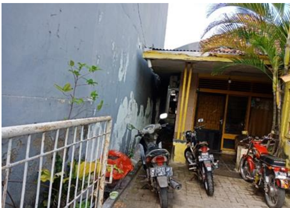
Jl Karanganyar II no 5