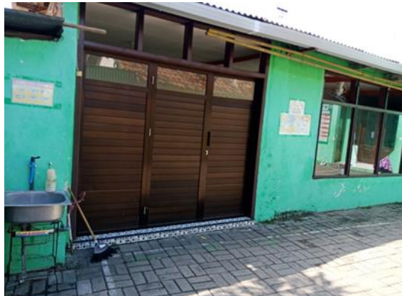
Jl Karanganyar III no 30