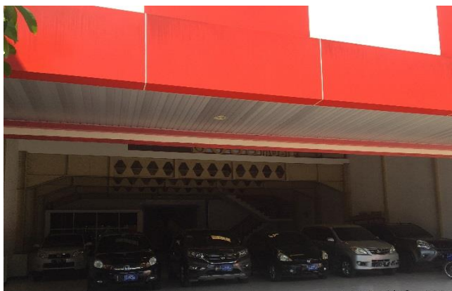
Makmur Sentosa Jl. Pucang Anom Timur No. 23 A