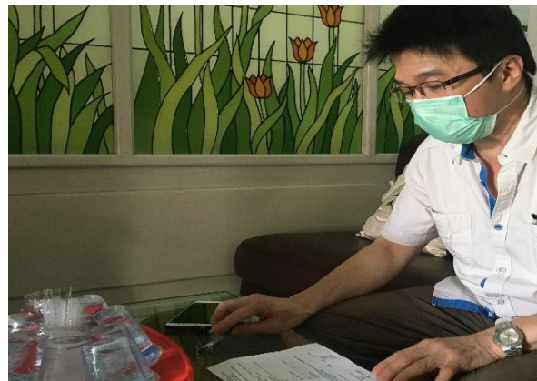
PT. Universal Inti Pacific Development Jl. Sumatera No. 91